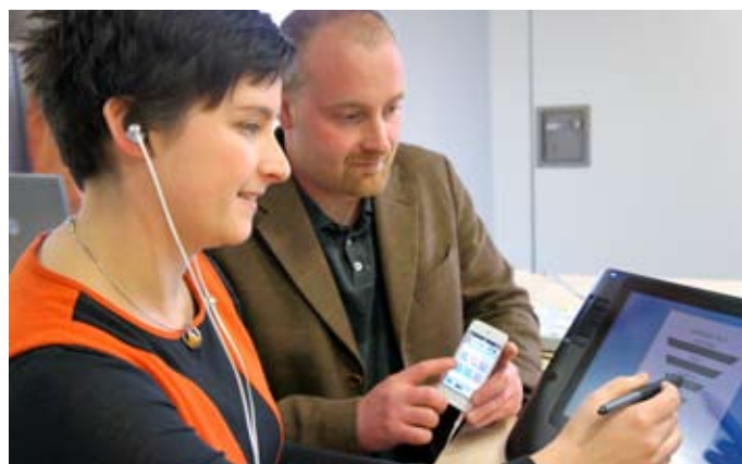
Abb. 3: Überprüfung der versorgten Lautheitswahrnehmung mittels Oldenburger Lautheitsskalierung (ACALOS).

Die Fittings umfassen einen flachen Hörverlust, Hochfrequenzverlust, diagonalen Hörverlustabfall und drei Varianten eines U-förmigen Hörverlustes. Um individuell die optimalen Fitparameter zu finden, war es dabei sehr nützlich, die Lautheitsskalierung der HörTech gGmbH aus Oldenburg zu verwenden. Die Parameter von BioAid wurden dabei so angepasst, dass die Lautheitsfunktion des Patienten möglichst ähnlich zu der Lautheitsfunktion eines Normalhörenden ist. Für jeden dieser Parametersätze wurden vier Varianten erstellt, die unterschiedliche Verstärkung bieten und damit unterschiedlichen Hörverlustgraden zugeordnet werden können.